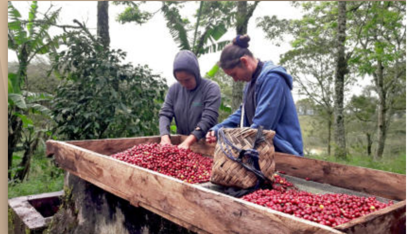
Sie werden anschließend nachsortiert und aufbereitet.

zwischen Nicaragua und Deutschland macht gegenseitige Besuche schwierig, aber per E-Mail und Video werden die Kleinbauern immer wieder aus ihrem Alltag berichten, sodass die Solawi-Gemeinschaft erfährt, wie es den Familien geht, welche Arbeiten auf den Feldern gerade erledigt werden und wann der Kaffee verschifft werden kann.