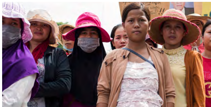
Kambodscha, 2023, Beschäftigte der Chung Fai Fabrik in Kambodscha protestieren für ihre Rechte. (Claudio Montesano Casillas).

Bangladesch, 2023, Arbeiter*innen der NGWF sind während der Mindestlohn- Proteste mit einer Polizeiblockade konfrontiert. (CCC).